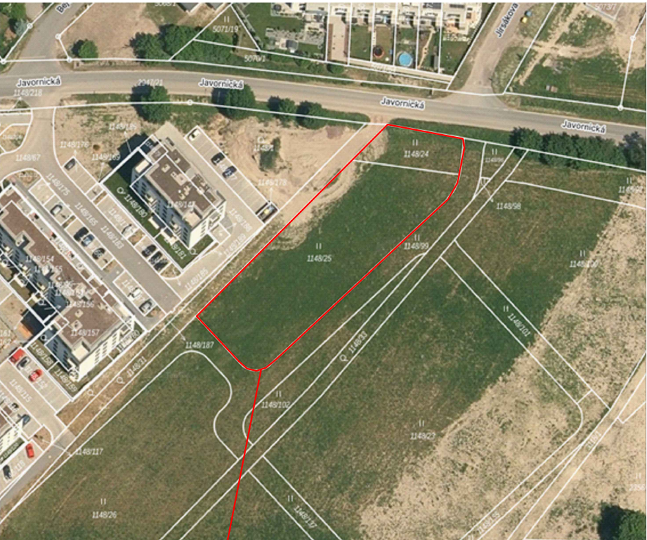
HRANICE ŘEŠENÉHO POZEMKU